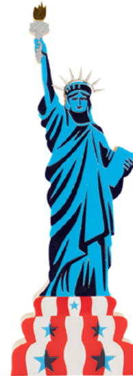
ESTÁTUA DA LIBERDADE NY002449 | 10X28X4,5