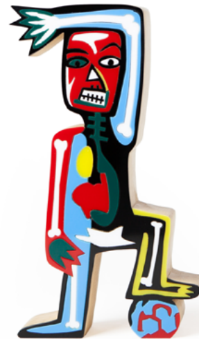
ESTATUETA FUTEBOLISTA (BASQUIAT) PS002073 | 24x13x4,5