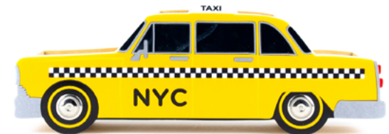
ORGANIZADOR TÁXI AMARELO NY002452 | 29x11x7,5